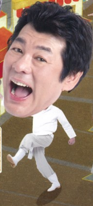
ぐうたらな親父 赤井英和